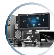
محصولات صوتی و تصویری