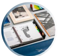
انواع محصولات چاپی