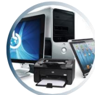
کامپیوتر و تجهیزات اداری