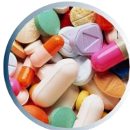
مکمل های غذایی طبیعی