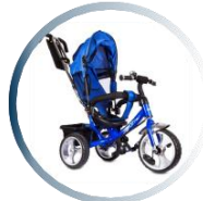
کالسکه و دوچرخه