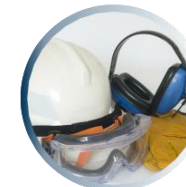
تجهیزات حفاظتی شخصی