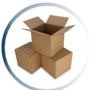
مواد اولیه و محصولات بسته بندی