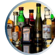
نوشیدنی های الکلی