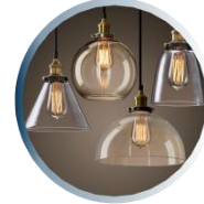
نور و روشنایی