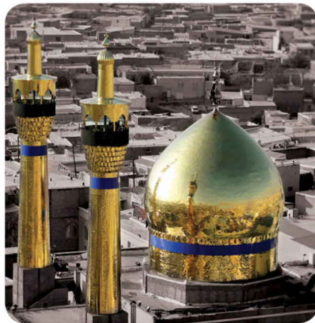
Благоприятные условия для инвестиций в туристическую деятельность в провинции Зенджан